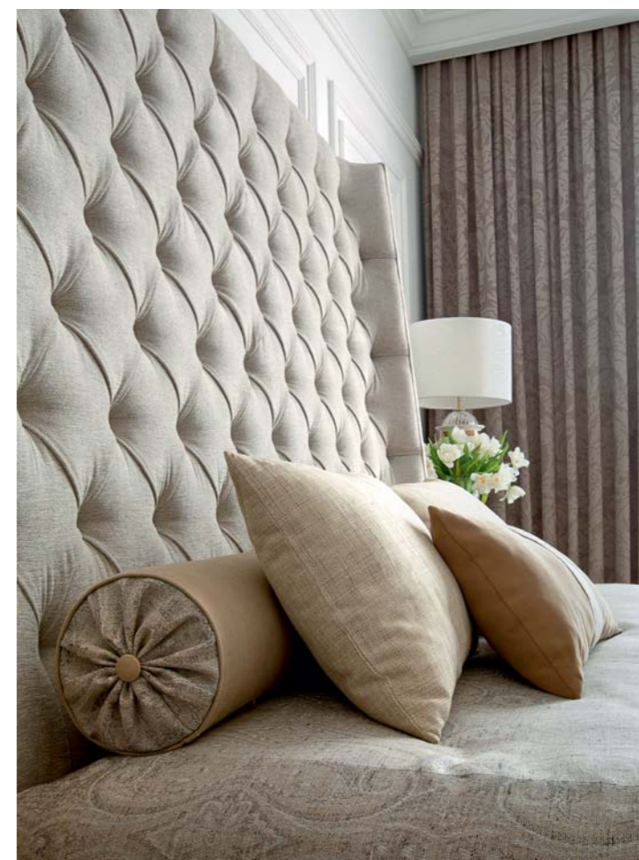
Спальня хозяев. Кровать, Meridiani. Тумбочки, Selva. Кресло, Mis en Demeure. Керамические лампы, Sigma L2. Лампы на комод, Il Paralume Marina. Шторы, покрывало, подушки, Hodsoll McKenzie (Zimmer+Rohde)